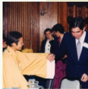
O presidente Óscar Arias Sánchez na Costa Rica em 1991.