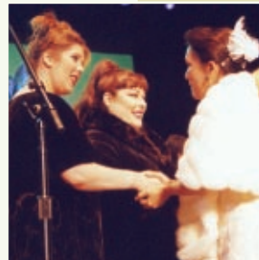
Sr as . Carnie e Wendy Wilson, do famoso Beach Boys Family & Friends, no concerto beneficente Um Mundo... de Paz através da Música em Los Angeles, na Califórnia, EUA, em 1998.