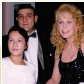
Srª. Stella Stevens, atriz americana ganhadora de prêmio Globo de Ouro, em Night of 100 Stars Oscar , festa de gala beneficente em Beverly Hills, na Califórnia, EUA, em 1999.