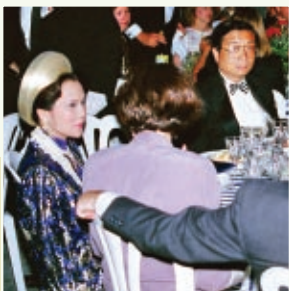
Um banquete presidencial em Washington, DC, nos EUA, em 1993.