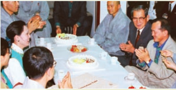
O major-general Jeon-Gwan desejou um feliz aniversário à Suprema Mestra Ching Hai na Coréia em 1993.