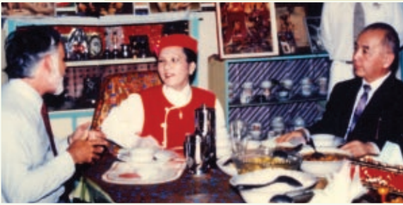
Os consulados americano e japonês receberam Suprema Mestra Ching Hai na Indonésia em 1993.