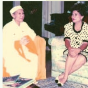
A segunda-dama Celia Diaz-Laurel nas Filipinas em 1992.