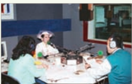
RFI Radio Paris, França 27 de janeiro de 1997