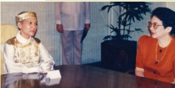
A presidente Corazón Cojuangco-Aquino se encontrou com Suprema Mestra Ching Hai para discutir o reassentamento dos refugiados nas Filipinas em 1992.