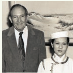
O congressista americano Earl Hutto convidou Suprema Mestra Ching Hai para visitar o Congresso em Washington, DC, nos EUA, em 1993.