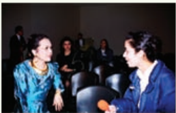
A francesa Radio Enghien Paris, França 27 de janeiro de 1997