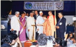
World Convention on Reverence For All Life Pune, Índia 11 de novembro de 1997