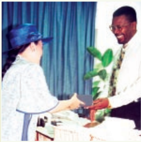
O primeiro-ministro Edison James em Dominica em 1996.