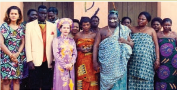
O rei Agboli-Agbo Dedjlani e o príncipe do Benin deram as boas-vindas à Suprema Mestre Ching Hai em Abomey, no Benin, em 1995.