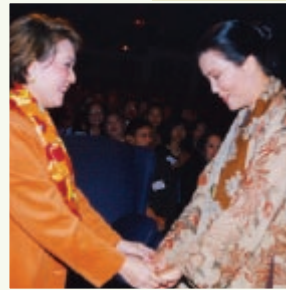
Sr a . Kiêu Chinh, célebre atriz aulacesa (vietnamita), no concerto beneficente Uma Jornada através dos Reinos da Estética em Washington, DC, nos EUA, em 1997.