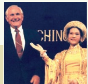
O prefeito Frank Fasi proclamou 25 de outubro como Dia da Suprema Mestra Ching Hai em Honolulu, no Havai, EUA, em 1993.