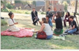
SABC TV Cidade do Cabo, África do Sul 1º de dezembro de 1999