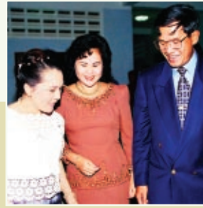
O primeiro-ministro Samdech Hun Sem e sua esposa Bun Ramy no Camboja em 1996.