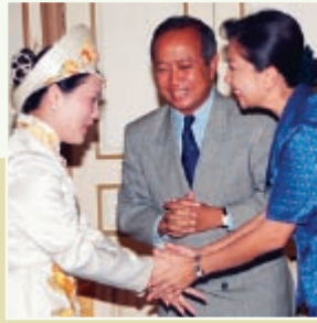
O príncipe Norodom Ranariddh e a princesa Marie Ranariddh no Camboja em 1996.