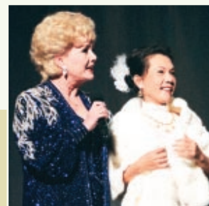
Srª. Debbie Reynolds, legendária atriz americana, no concerto beneficente Um Mundo... de Paz através da Música em Los Angeles, na Califórnia, EUA, em 1998.