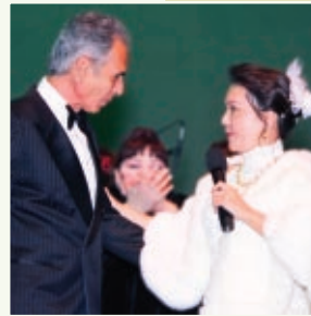
Sr. Bill Conti, compositor americano ganhador de prêmios Oscar e Emmy no concerto beneficente Um Mundo... de Paz através da Música em Los Angeles, na Califórnia, EUA, em 1998.