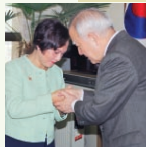
O prefeito Cho Soon expressou sua expectativa de que Suprema Mestre Ching Hai visitasse Coréia frequentemente para proferir palestras a bem da iluminação espiritual do povo coreano, em Seul, na Coréia, em 1997.