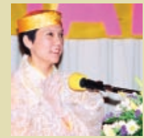
Suprema Mestra Ching Hai proferiu palestras nas Nações Unidas em Nova Iorque, nos EUA, em 1991 e 1992, e novamente em Genebra, na Suíça, em 1993. (foto: Nações Unidas, Nova Iorque, EUA, 1992)

“Ela é a luz de uma grande pessoa, um anjo da misericórdia para todos nós.”