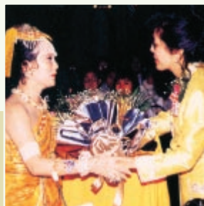
Sr a . Sudarat Keyuraphan, vice-porta-voz governamental, foi a anfitriã de um banquete de boas-vindas realizado pelo Ministério das Relações Exteriores para Suprema Mestra Ching Hai, que foi acompanhada ao evento pelo Sr. Nimitr Ajchariyakitisakool, secretário do ministro das Relações Exteriores, na Tailândia em 1993.