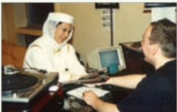
Schweizer Radio DRS Suíça 1993