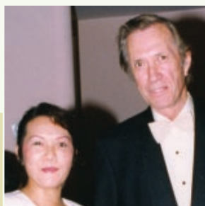
Sr. David Carradine, legendário ator americano, em Night of 100 Stars Oscar , festa de gala beneficente em Beverly Hills, na Califórnia, EUA, em 1999.