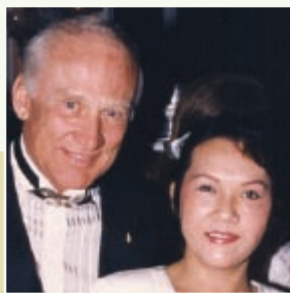
O astronauta americano Buzz Aldrin , segundo homem a pisar os pés na lua, em Night of 100 Stars Oscar , festa de gala beneficente em Beverly Hills, na Califórnia, EUA, em 1999.