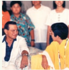
O vice-presidente Salvador Laurel nas Filipinas em 1991.