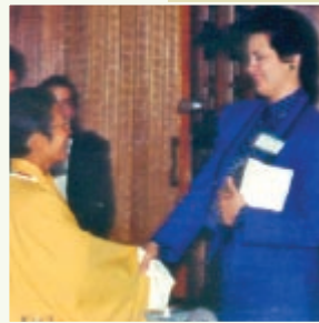
A ex-primeira dama Margarita Penón Góngora na Costa Rica em 1991.