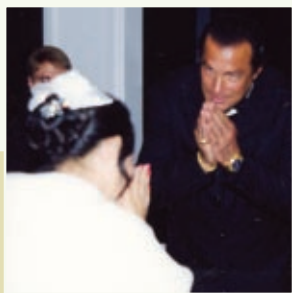
Sr. Steven Seagal, famoso ator americano, na 19ª festa de gala beneficente anual de St. Jude Children's Research Hospital em Beverly Hills, na Califórnia, EUA, em 1999.