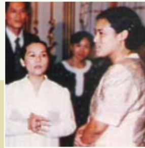
A princesa Maha Chakri Sirindhorn na Tailândia em 1994.