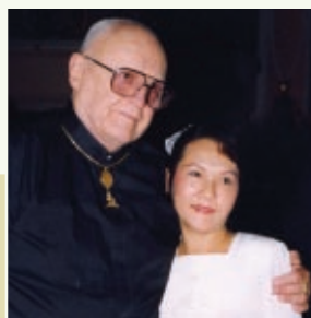
Sr. Rod Steiger, ator americano ganhador de prêmio Oscar, em Night of 100 Stars Oscar , festa de gala beneficente em Beverly Hills, na Califórnia, EUA, em 1999.