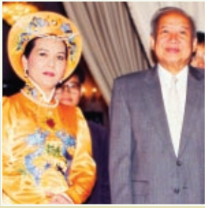
O rei Preah Bat Samdech Preah Norodom Sihanouk Varman recebeu Suprema Mestra Ching Hai em seu palácio real no Camboja e lhe presenteou um vaso como um símbolo de amizade em 1996.