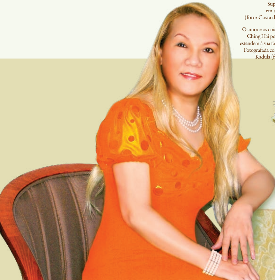
Suprema Mestra Ching Hai em uma viagem humanitária (foto: Costa do Marfim, África, 1995)

O amor e os cuidados da Suprema Mestra Ching Hai pelos coabitantes animais se estendem à sua família de 10 cães e 22 aves. Fotografada com seu cão Benny e sua ave Kadula (foto: Flórida, EUA, 2001)