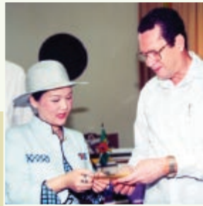
O presidente Crispin Sorhaindo em Dominica em 1996.